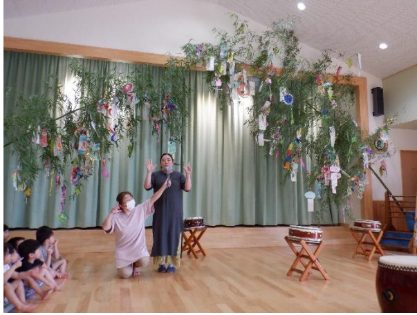
ぞうさんくもの巣の手遊びをしました ♪一人のぞうさんくもの巣に～♪