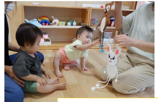
わらべ歌 「やすべいじしい」に興味津々でした