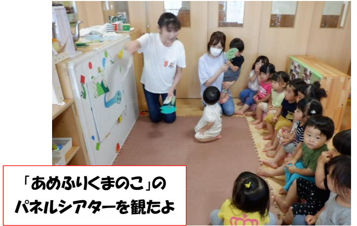
「あめふりくまのこ」の パネルシアターを観たよ