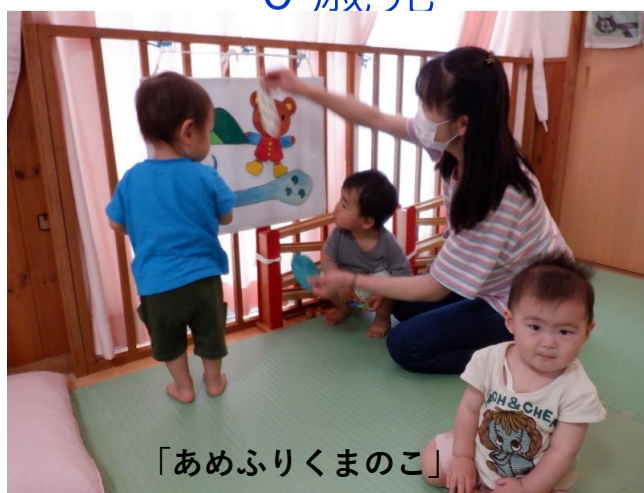
「あめふりくまのこ」