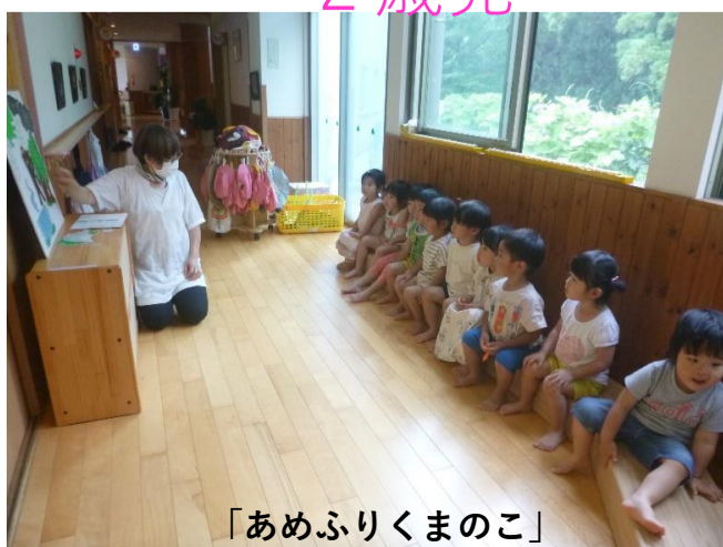
「あめふりくまのこ」