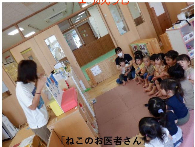
「ねこのお医者さん」