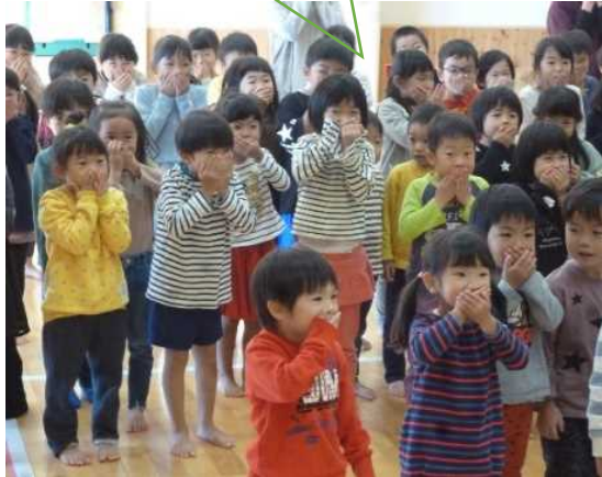
「さ」のところでおくちをか くしてうたったよ♪

「まほっくりが〜あったとさあ〜♪ げんきにうたいました！ 「あれ？おさるさんが（さ）をたべちゃった」 「（さ）がなくても、うたえるかな？」