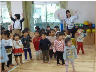
おどり「けらけらじゃんけん」

「かにさんがけがした んだって...」 「どうやって、さるさ んをやっつけよう？」 うすとくりとはちがそ うだんしてるよ